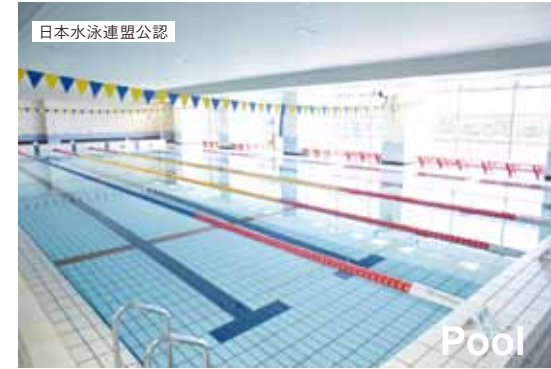
日本水泳連盟公認