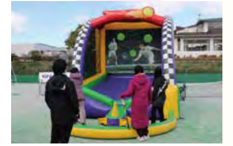
ターゲットテニス