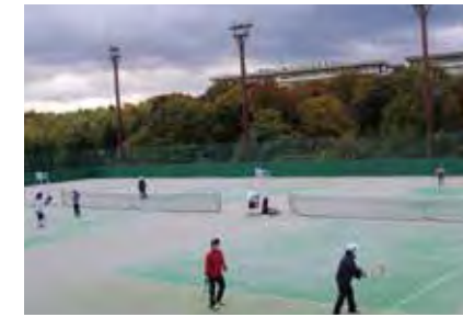
ダブルストーナメント